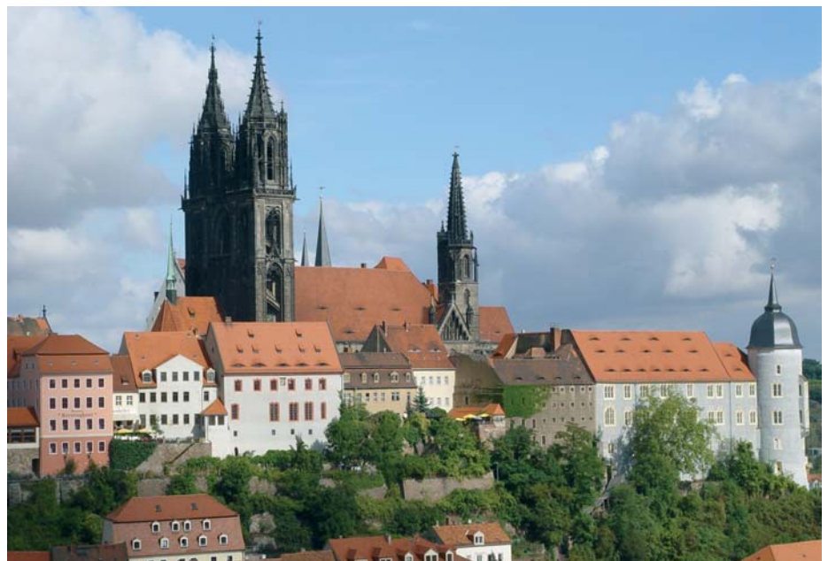
Meißen und die Albrechtsburg