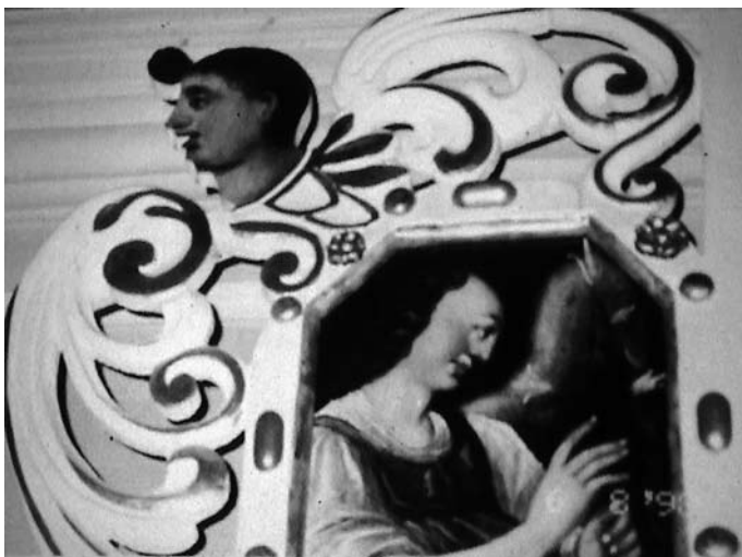
Altar in Wehrkirche, Großrückerswalde (Detail)