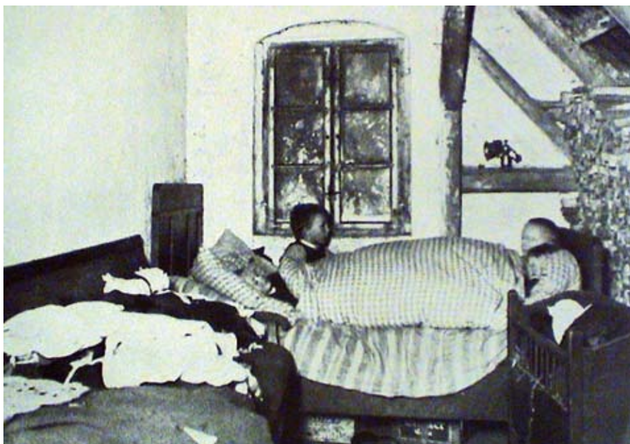
Schlafzimmer der Kretin-Familie