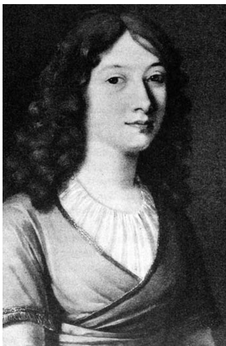
Charlotte von Lengefeld (Gemälde von Ludovika Simanowitz, um 1794)

Immer wiederkehrende Sorge um die Gesundheit Friedrich Schillers und die meist vorhandenen Geldnöte trübten das Dasein. Charlotte lebte ganz in Schiller und nur für ihn. Ein sicherer Geschmack in ihren Ansichten war ihr in der ehelichen Harmonie angeboren. Das Gefühl dieser gebildeten Frau ward nicht selten ein bestimmendes Urteil für ihn. Der Widerwillen gegen alles Gemeine lag in ihr wie in ihm. Schillers waren ein Paar, das miteinander und nicht nebeneinander lebte. Ihr Mann, seine Arbeit und ihre Kinder, die beiden Knaben Karl und Ernst, die Mädchen Caroline und zuletzt Emilie waren der Mittelpunkt ihres Lebens. 1802 hatte der Großherzog von Weimar Schiller geadelt; damit hatte Charlotte wieder Zugang zum Hofe. Als Schiller im Winter 1803 zu 1804 am Wilhelm Tell arbeitet, unterstützt ihn seine Frau durch Schilderungen von Land und Leuten der Schweiz aus eigener Anschauung und der ihr zur Verfügung stehenden Literatur. Schiller selbst hatte