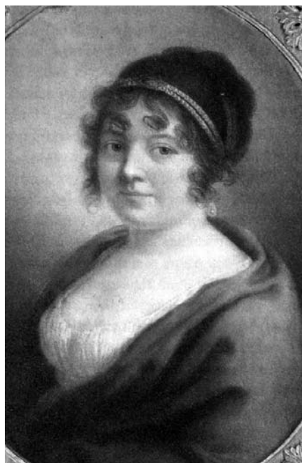
Caroline von Lengefeld (Pastell von unbekannter Hand)