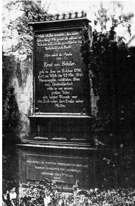
Grabstele, Charlotte von Schiller und ihr Sohn Ernst von Schiller, auf dem alten Friedhof in Bonn.

Nach Schillers Tod lebte Charlotte für die Erziehung ihrer vier talentvollen Kinder. Trotz ihrer Bemühungen war es später nicht möglich, dass ihre beiden Söhne am Hofe von Sachsen-Weimar eine Anstellung erhielten,