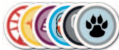
Abbildung 2: Badges

davon in Zweifel gezogen, auch wenn in seltenen Fällen Zweifel angebracht sind. Dann wird lediglich darauf verwiesen, den behandelnden Arzt zu konsultieren.