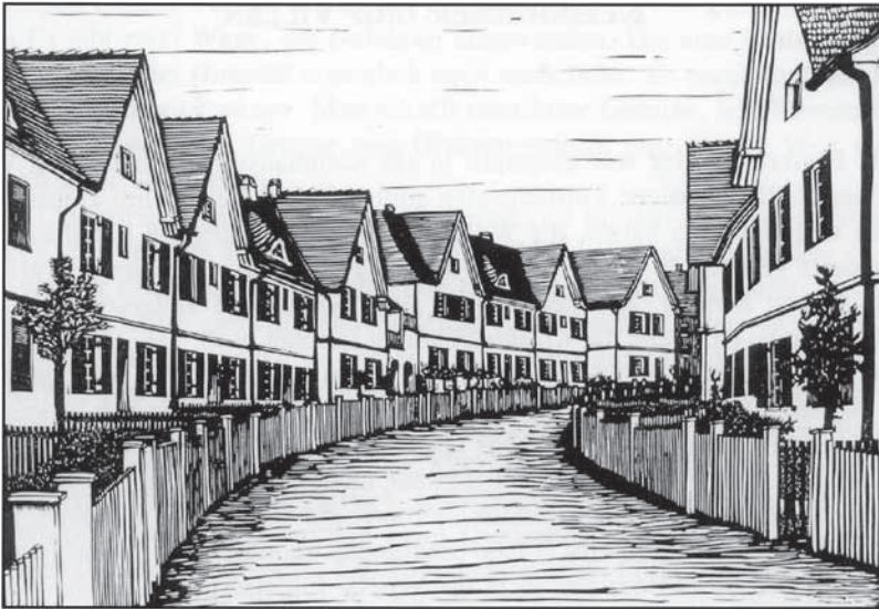
Abbildung 1: Am Dorffrieden in Hellerau