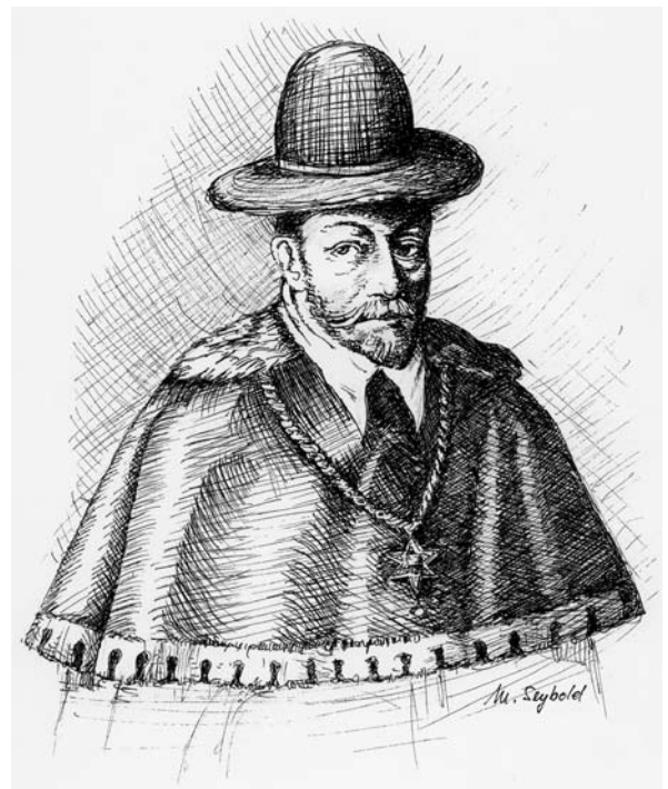
Johannes Jessenius

Anschließend verweilte er einige Wochen in Prag und knüpfte Kontakte zum böhmischen Adel, zur Karls-Universität und zum kaiserlichen Hof (Rudolf II.). Mit Einschaltung des Kaisers und auf eigenen Wunsch ließ sich Jessenius im August 1602 aus kursächsischen Diensten entlassen. Im Herbst 1602 zog er