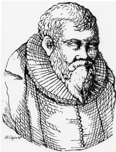
Salomon Alberti Zeichnung nach einer Computervorlage: Maritta Seybold, Plauen

Salomon Alberti und Johannes Jessenius von Jessen hatten in der 2. Hälfte des 16. Jahrhunderts an der Universität Wittenberg eine Professur als Mediziner inne. Beide Männer waren etwa zur gleichen Zeit auch kurfürstliche Leibärzte am Dresdener Hof, das heißt, sie kannten sich. Sie hinterließen auf unterschiedliche