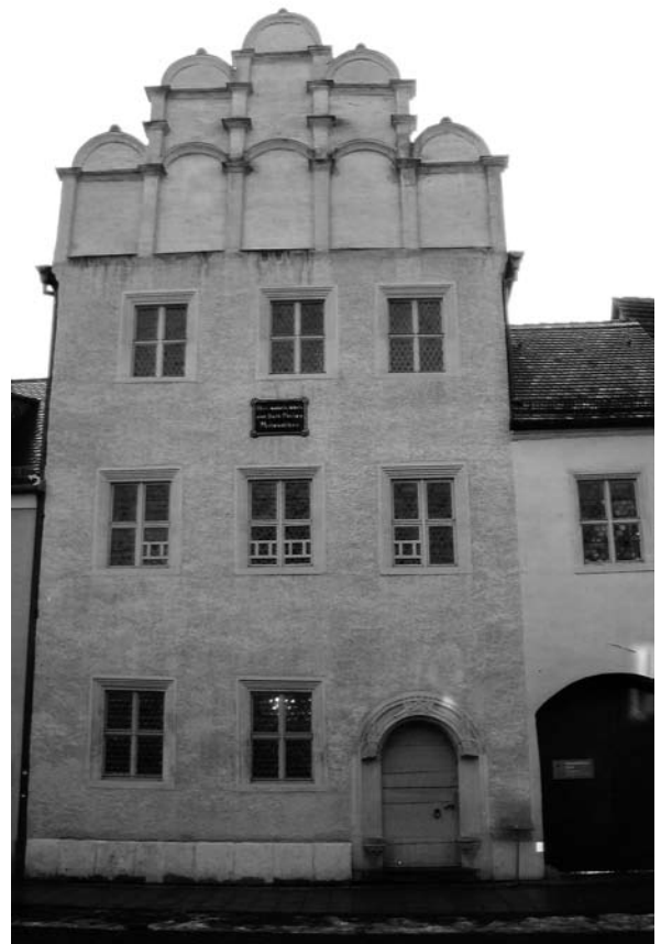
Melanchthonhaus in Wittenberg