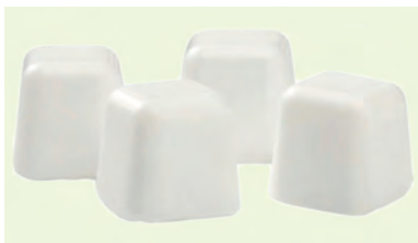
Für Kinder unbedingt unzugänglich aufbewahren: Kohleanzünder