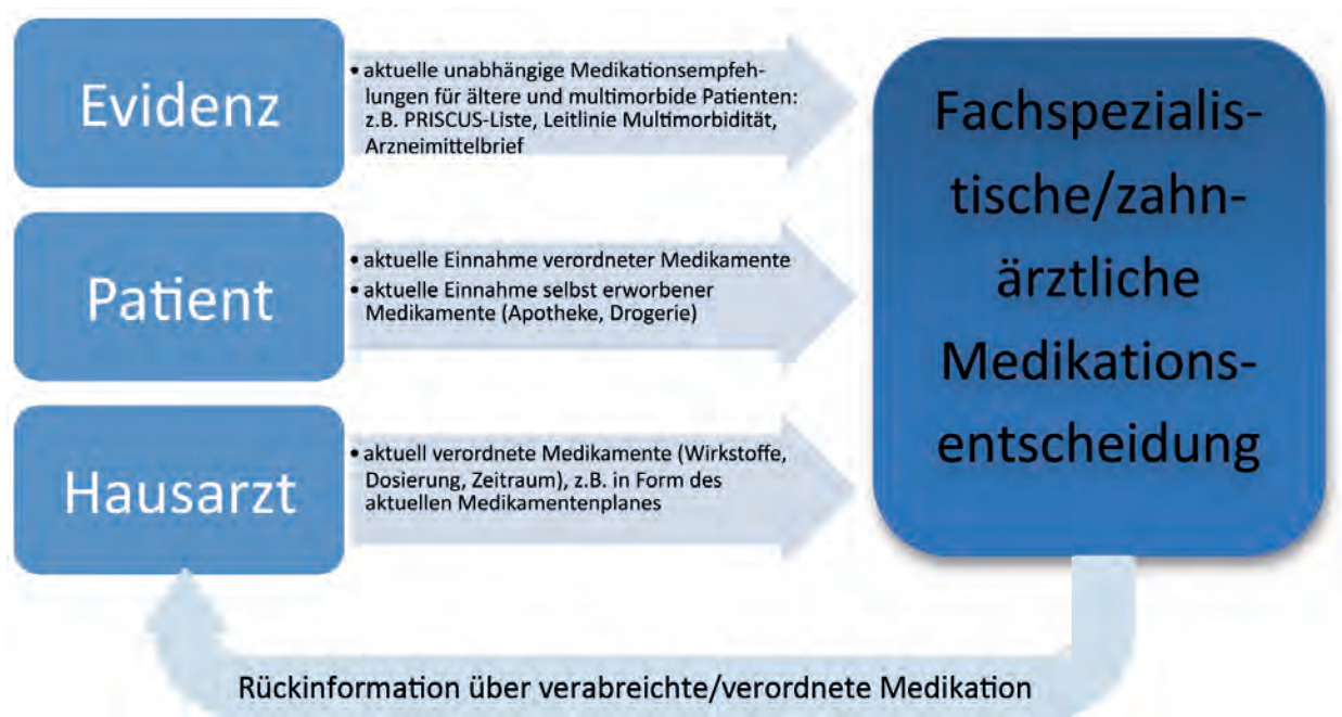
Abb. 2: Informationsquellen für Medikationsentscheidungen

nen zu vorliegenden Dauerdiagnosen, die Einfluss auf Compliance/Gesundheitsverhalten haben können, sowie zur Medikation bedarfsorientiert ausgetauscht werden, zum Beispiel durch Übermittlung von Medikationsplänen und für die Medikation relevanten bestehenden Dauer-, gegebenenfalls Akutdiagnosen. Parallel sollte bei älteren Patienten vor medizinischen Interventionen die aktuelle Medikation (Wirkstoff und Dosierung) abgefragt werden. Dies könnte über einen Fragebogen zu aktuellen Medikamenteneinnahmen erfolgen, um auch den Hausärzten/Geriatern nicht bekannte verordnete oder freiverkäuflich erworbene Medikamente zu erfassen. Der Fragebogen sollte vom Patienten am besten zu Hause ausgefüllt werden, wo ihm die Daten (Medikamentenverpackungen) auch zur Verfügung stehen, um eine möglichst vollständige und genaue Rückmeldung zu erhalten.