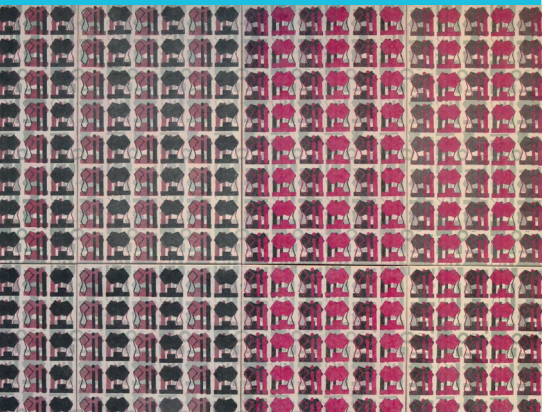
M 92 - achteilig, 2021, Linolstempeldruck auf Japanpapier, 170 x 220 cm (Detail)

Über aktuelle Einlassbestimmungen informieren Sie sich bitte unter www.slaek.de