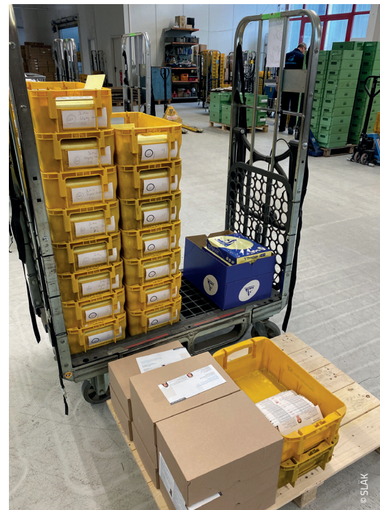
und die (Wahl-)Briefbelege wachsen.